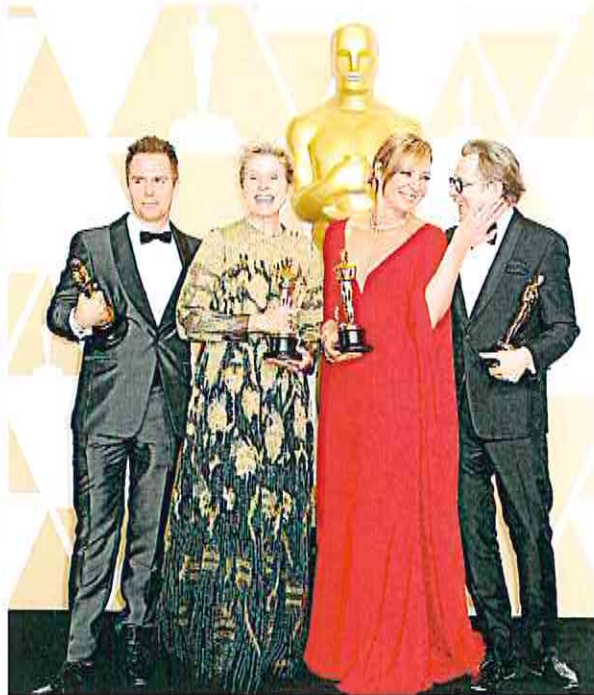
El cineasta Guillermo del Toro y los actores Sam Rockwell, Frances McDormand, Allison Janney Gary Oldman, con sus respectivos Óscar.