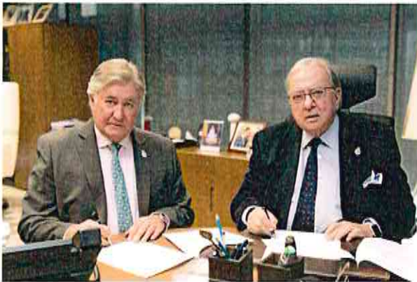
Colegio de Veterinarios de Toledo y Ama Vida

El Colegio de Veterinarios de Toledo ha firmado con AMA Vida la póliza colectiva de Vida.